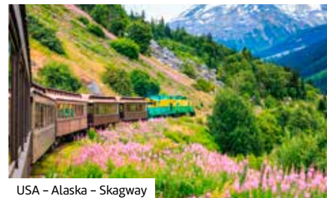
USA – Alaska – Skagway

Von Anchorage über den Denali Nationalpark und Dawson City bis in den Yukon erwarten Sie spektakuläre Landschaften. Danach genießen Sie an Bord der Celebrity Summit eine Kreuzfahrt entlang der Inside Passage mit Stopps in Juneau, Skagway und Ketchikan – ein eisiges Abenteuer!