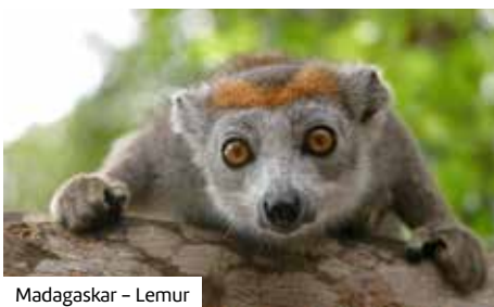
Madagaskar – Lemur