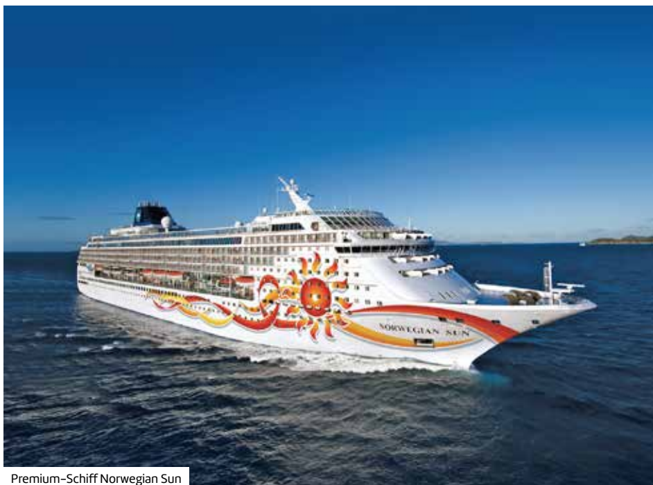
Premium-Schiff Norwegian Sun