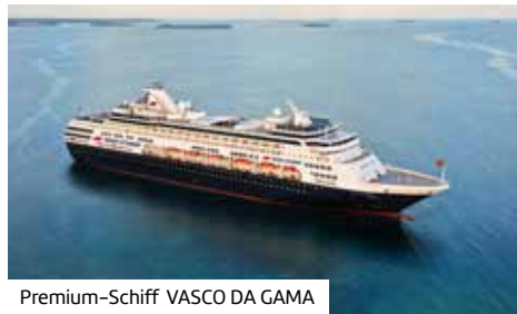
Premium-Schiff VASCO DA GAMA