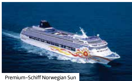
Premium-Schiff Norwegian Sun