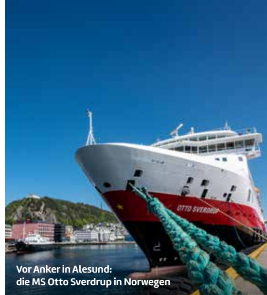
Vor Anker in Alesund: die MS Otto Sverdrup in Norwegen