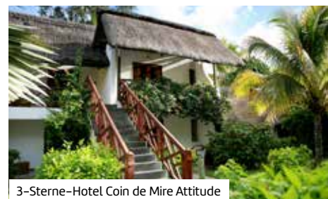
3-Sterne-Hotel Coin de Mire Attitude

Von Mauritius nach Kapstadt: Entspannen Sie an paradiesischen Stränden, bevor Sie an Bord der Norwegian Sun gehen, welche Sie nach La Réunion und Madagaskar führt. Anschließend entdecken Sie auf einer Rundreise die vielseitige Regenbogennation Südafrika.