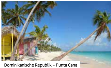
Dominikanische Republik – Punta Cana