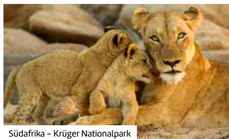
Südafrika – Krüger Nationalpark