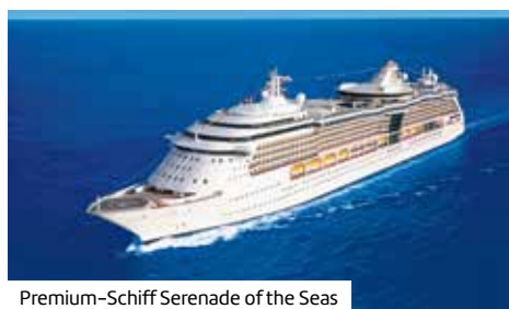
Premium-Schiff Serenade of the Seas