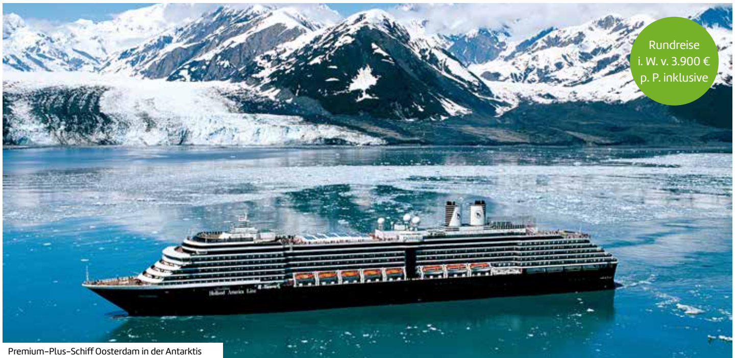
Premium-Plus-Schiff Oosterdam in der Antarktis

Rundreise i. W. v. 3.900 € p. P. inklusive