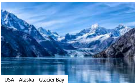
USA – Alaska – Glacier Bay