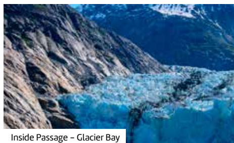
Inside Passage – Glacier Bay