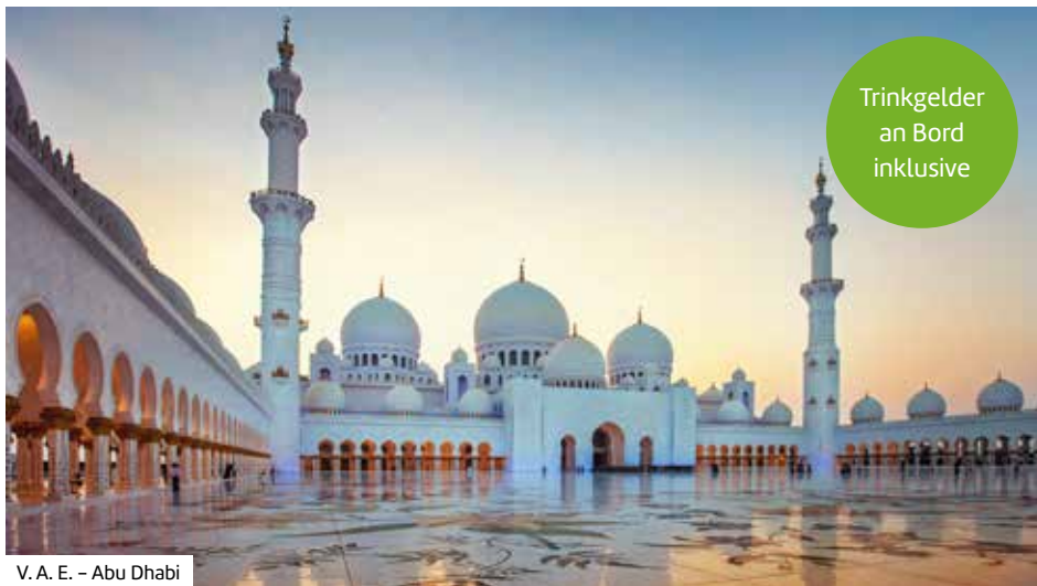
V. A. E. – Abu Dhabi