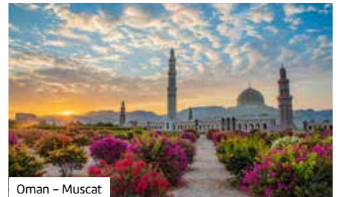
Oman – Muscat

Starten Sie Ihre Reise mit einer Safari im legendären Krüger Nationalpark, bestaunen Sie den Blyde River Canyon und genießen Sie den Komfort an Bord von Mein Schiff 4 . Erkunden Sie dann noch die Metro-pole Dubai, das kulturelle Muscat und das beeindruckende Abu Dhabi!