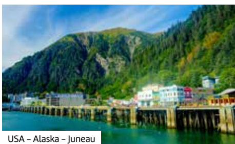
USA – Alaska – Juneau