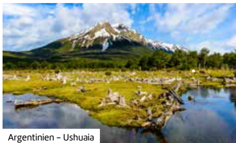
Argentinien – Ushuaia