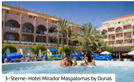
3-Sterne-Hotel Mirador Maspalomas by Dunas