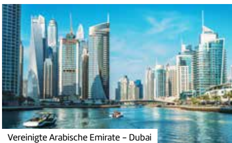
Vereinigte Arabische Emirate – Dubai