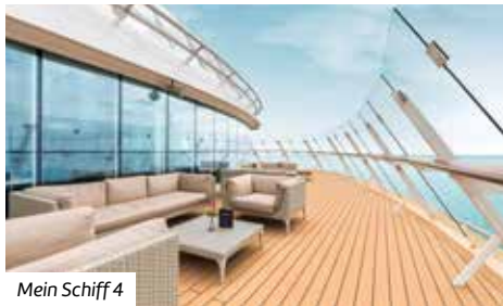
Mein Schiff 4