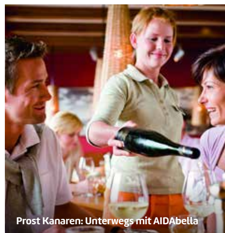
Prost Kanaren: Unterwegs mit AIDAbella