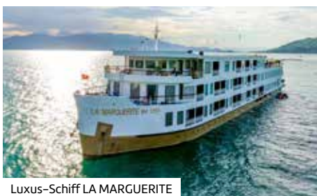
Luxus-Schiff LA MARGUERITE