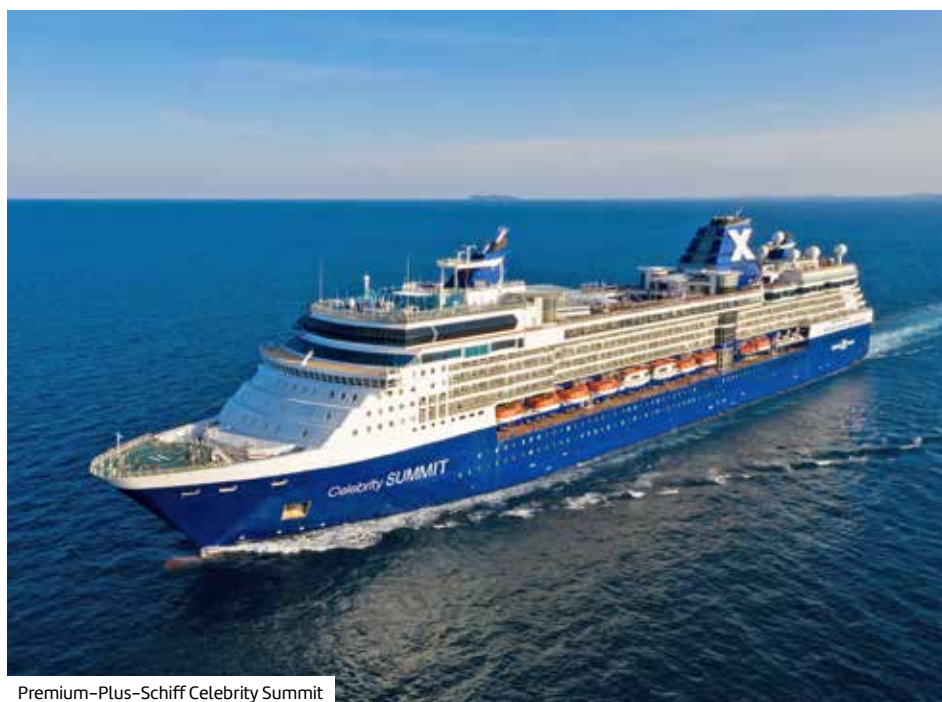
Premium-Plus-Schiff Celebrity Summit