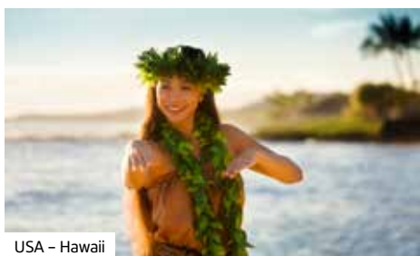
USA – Hawaii