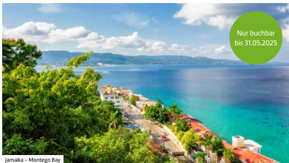
Jamaika – Montego Bay