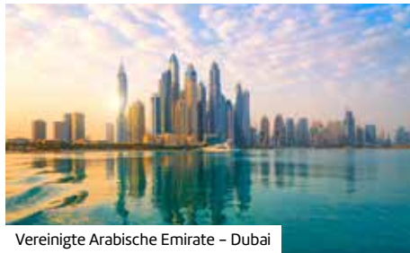
Vereinigte Arabische Emirate – Dubai