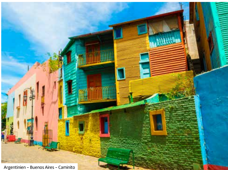
Argentinien – Buenos Aires – Caminito