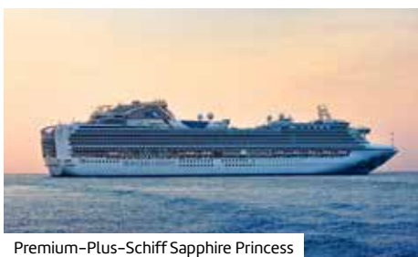
Premium-Plus-Schiff Sapphire Princess