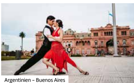
Argentinien – Buenos Aires