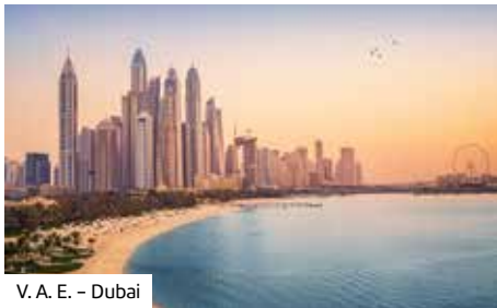
V. A. E. – Dubai