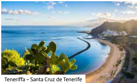
Teneriffa – Santa Cruz de Tenerife