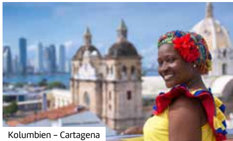
Kolumbien – Cartagena