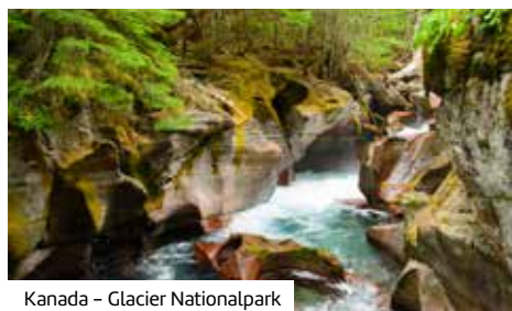
Kanada – Glacier Nationalpark