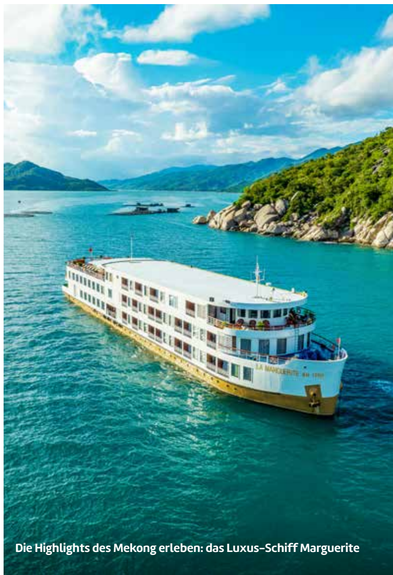
Die Highlights des Mekong erleben: das Luxus-Schiff Marguerite