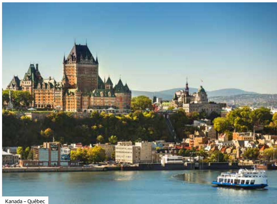
Kanada – Québec