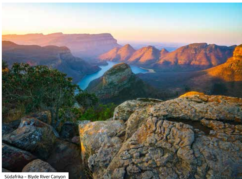
Südafrika – Blyde River Canyon