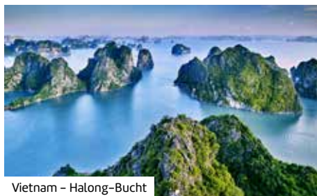
Vietnam – Halong-Bucht