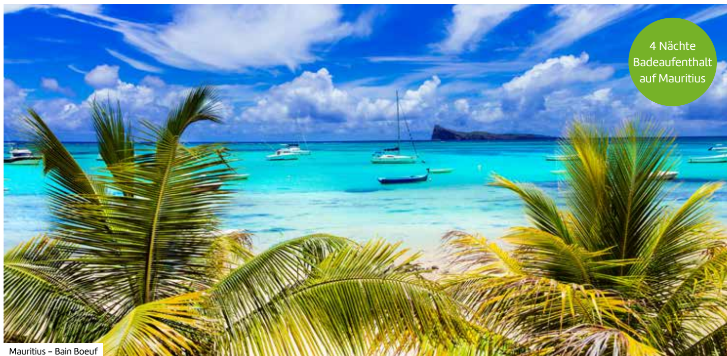
Mauritius – Bain Boeuf