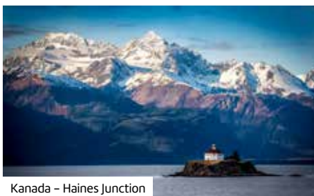
Kanada – Haines Junction