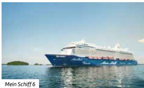
Mein Schiff 6