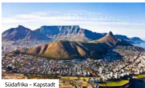
Südafrika – Kapstadt