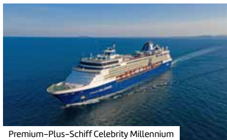
Premium-Plus-Schiff Celebrity Millennium