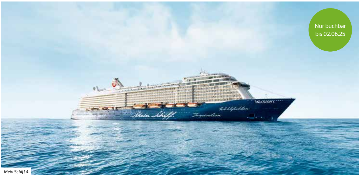
Mein Schiff 4