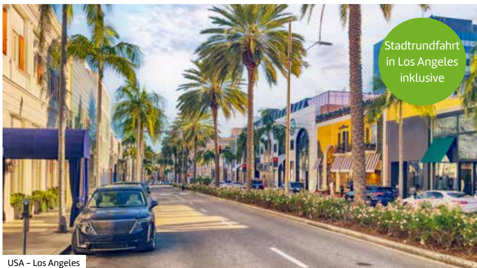
USA – Los Angeles