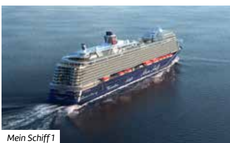
Mein Schiff 1