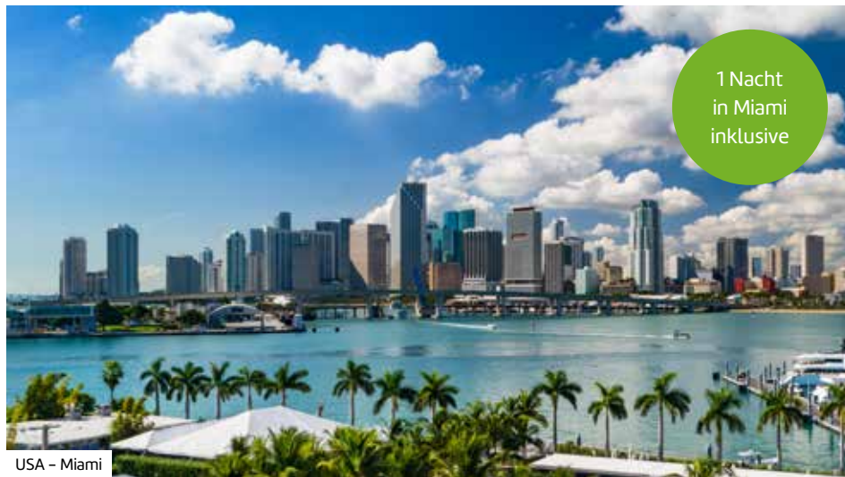
USA - Miami