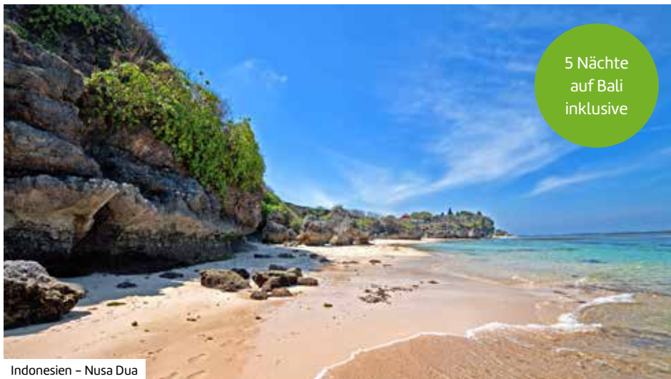
Indonesien – Nusa Dua