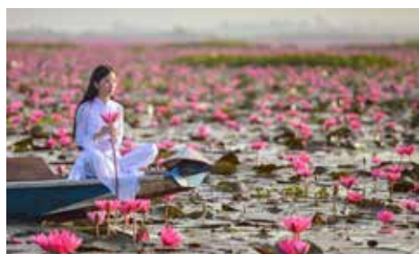
Kambodscha – Siem Reap – Angkor Wat