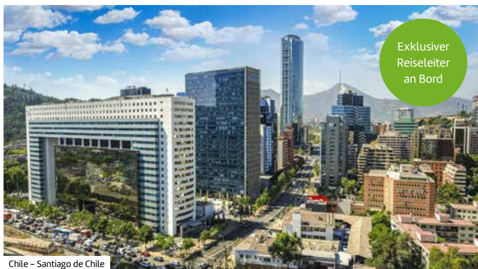
Chile – Santiago de Chile