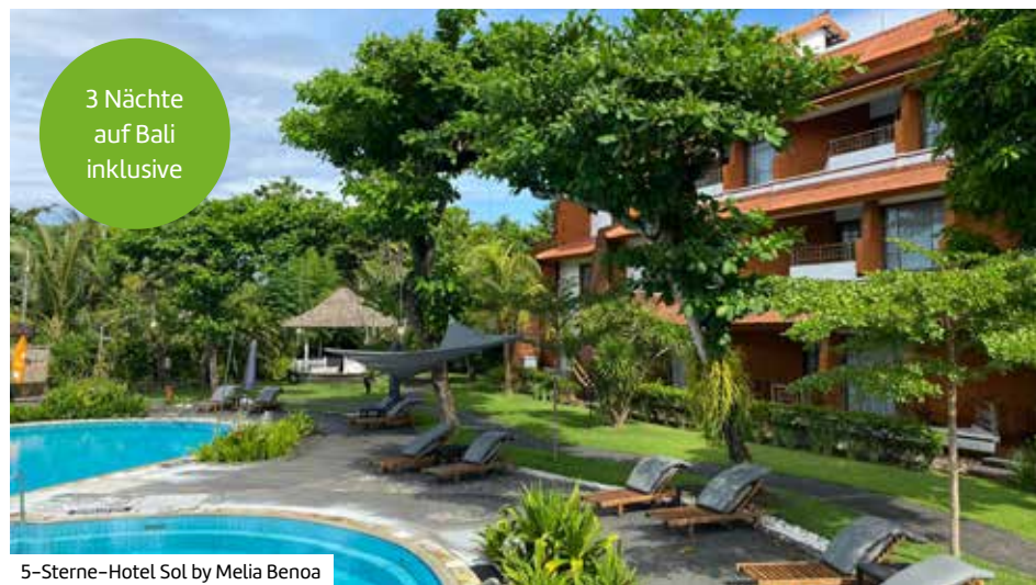
5-Sterne-Hotel Sol by Melia Benoa