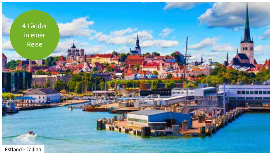
Estland – Tallinn