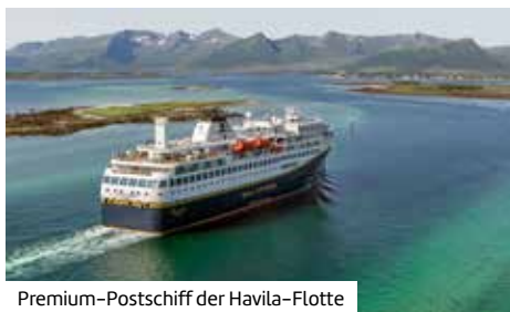
Premium-Postschiff der Havila-Flotte