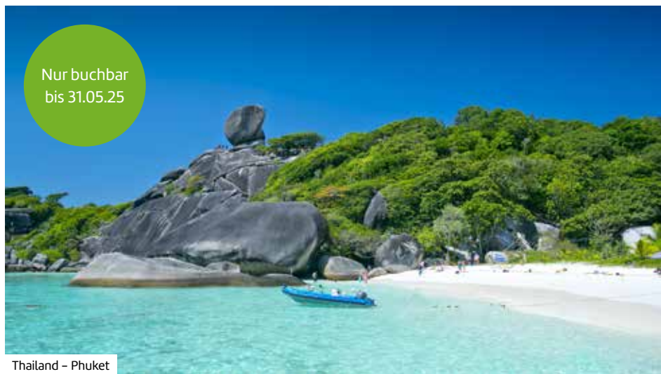
Thailand – Phuket