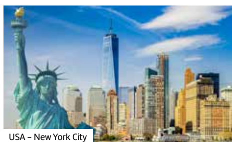
USA – New York City