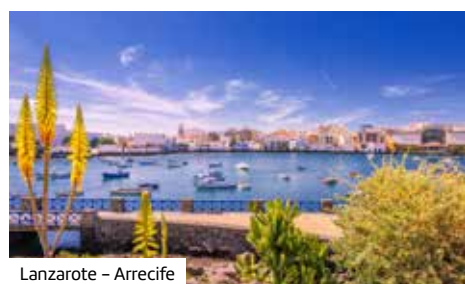
Lanzarote – Arrecife