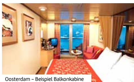
Oosterdam – Beispiel Balkonkabine