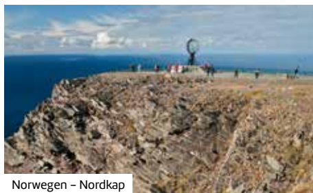
Norwegen – Nordkap