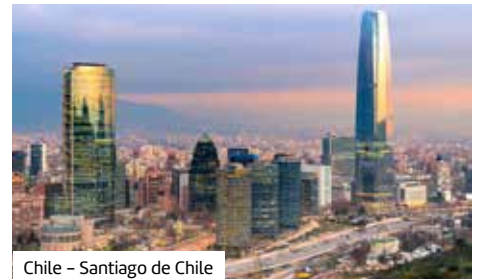
Chile – Santiago de Chile

Entdecken Sie die einzigartige Naturvielfalt und vielseitige Kultur Südamerikas. Lassen Sie sich von der eisigen Schönheit der Antarktis verzaubern, erkunden Sie die Metropolen Rio de Janeiro, Buenos Aires und Montevideo und genießen Sie die beeindruckende Fjordlandschaft Chiles.